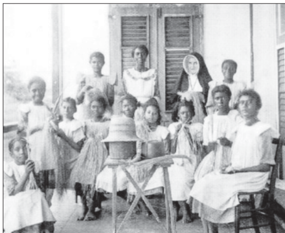
Een zuster, een onderwijzeres en meisjes die hoeden leren vlechten (1925). Op de andere foto een vrouw die hoeden vlecht.

BRONNEN: JAARVERSLAGEN SCHOOLCOMMISSIE EN DE AMIGOE 1915-1935.